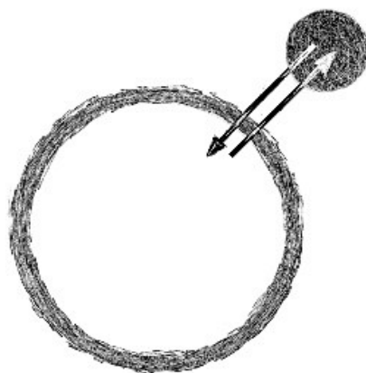
Relatie dirigent en zangers

Die zelf, weliswaar in een andere rol, ook deel uitmaakt van het geheel. Die het samenspel van de persoonlijke groei (het ‘zich openen’) van de individuele zanger en de samenwerking (de verantwoordelijkheid van het individu ten opzichte van het geheel) volgt, stimuleert en waar nodig bijstuurt.