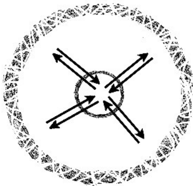
Relatie koor en samenleving

Wij durven te stellen dat het koorleven de samenleving schraagt en het karakter van de zangers